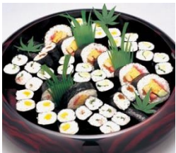
通夜料理 75名様対応分

各祭壇に下記項目が共通して含まれます。人数の超過が無ければ追加料金はありません。