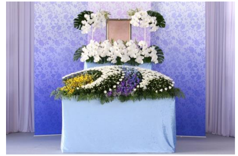
花祭壇 B タイプの場合