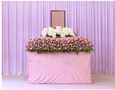
花祭壇 A タイプの場合