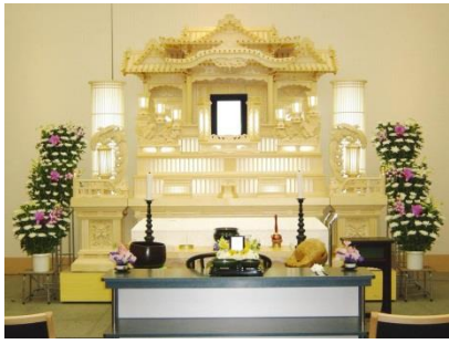
白木祭壇の場合 518,000円 税別